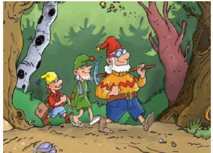
Zwerg Stolperli, Schlofmötzli und Alleswösserli auf dem Weg zum Stolperliweg.

Schon vor Jahren haben sie aus Holz und Steinen ein Häuschen errichtet und mit Blättern und Moos ein Dach darüber gebaut. Wenn es regnet, tropft es ab und zu herein, aber im Grossen und Ganzen ist es warm und gemütlich...»